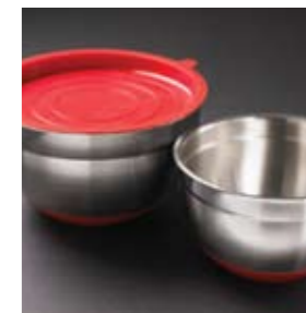
Dalla Pizzas rostfria skålar med silikonbotten gör att de står stadigt och du kan vispa med en hand.