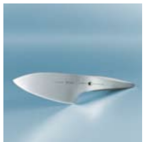
Type 301 Design by F.A. Porsche. Kniven som bokstavligt står i en klass för sig själv.

Så när det handlar om knivar så finns urvalet hos oss: Type 301 design by F. A. Porsche, Satake, Kyocera och Mac. Här finns också tillbehören, som slipstenar och brynen. Vill du veta hur "en slipsten ska dras" så är du välkommen till vår slipskola på www.vikingsun.se