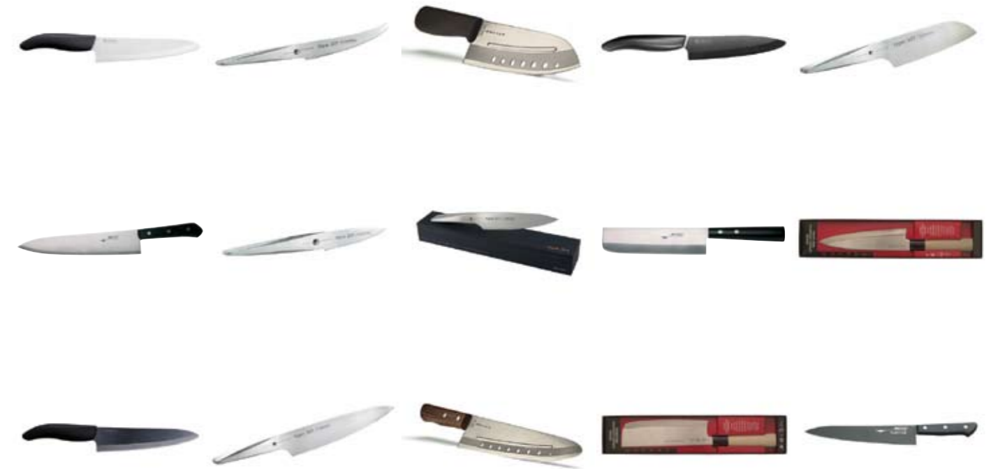
Type 301 Design by F.A. Porsche - Design och funktion, Satake - Japansk tradition, Kyocera - Hi Tech i köket, Mac - Proffskockarna val.

I stort sett alla kockar är överens om att kniven är det viktigaste redskapet i köket. Och allt fler hobbykockar börjar också förstå värdet av en bra uppsättning knivar i köket. Du kan ha hur många specialmaskiner som helst i skåpet, det som garanterat aldrig samlar damm är dina köksknivar.